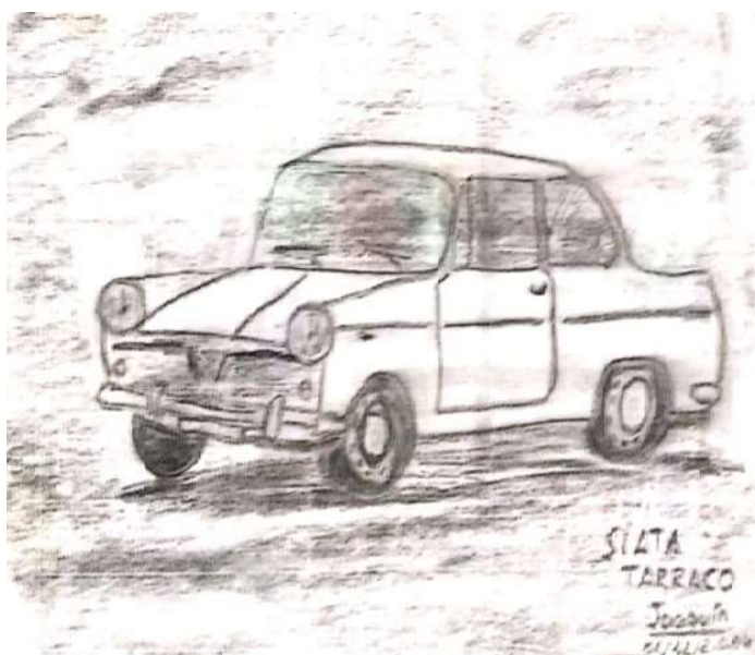
Ilustración de Joaquín Casis Domínguez

se subía a sus vehículos, desaparecía en el aire; dejando una gran estela de su delicado perfume, y una gran luminosidad de bellísimas luces de colores. En muchas ocasiones los conductores, no recordaban qué les había ocurrido en realidad, hasta tiempo después cuando les venía un vago recuerdo a la mente, al pasar nuevamente por dicha avenida.